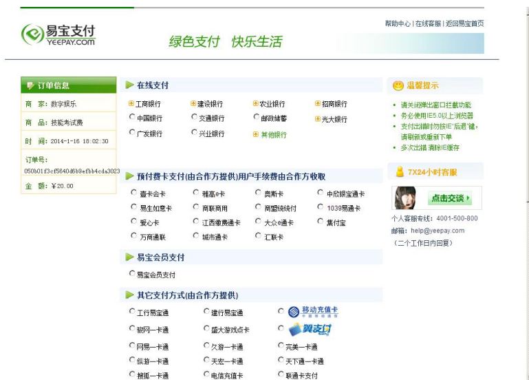
图示：通过网银缴费