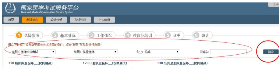
图示通过筛选条件快速寻找考试科目

开始报名后，首先需要选择报考考试科目（医考考试即为考试类别/级别）。由于考试科目繁多，用户可通过设置页面顶部的筛选条件进行检索。