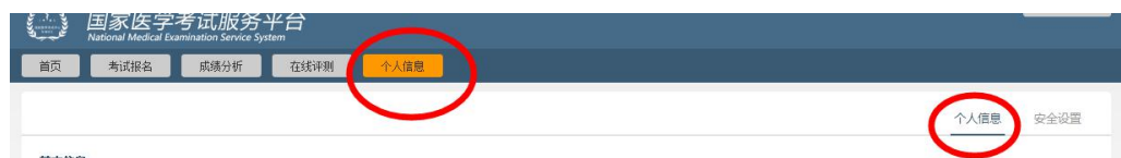
图示选择“个人信息”标签进行模块跳转

用户注册成功后首次进入系统将直接跳转至个人信息模块，以后登录后将显示首页信息。通过点击“个人信息”标签进入，开始完善个人信息。