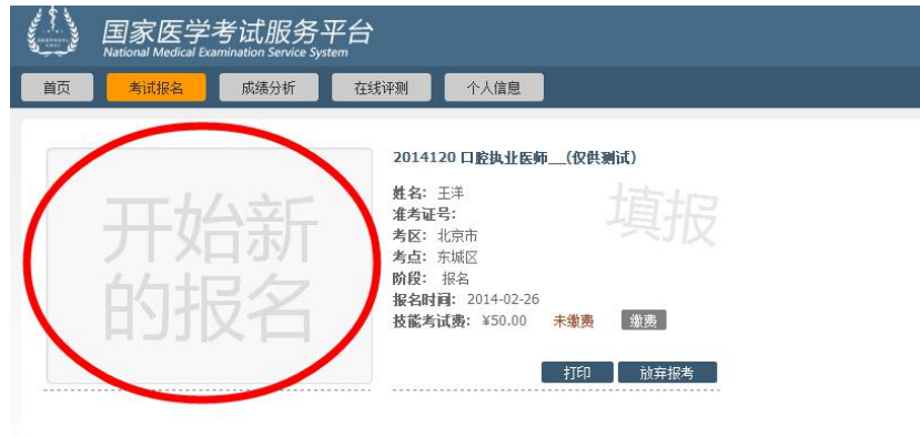
图示为考试报名模块的显示效果

页面左首显示为“开始新的报名”，点击“开始新的报名”即可开始进行报名操作。同时在右侧会顺序列出在考试平台中曾经报考的考试项目及基本情况。注意：报名信息不提供修改功能，请务必检查自己所报考的考试科目，考区/考点是否正确；如发现报考有误，在网上报名期间，可通过报考项目方框右下方的“放弃报考”予以放弃，然后重新“开始新的报名”进行报名。