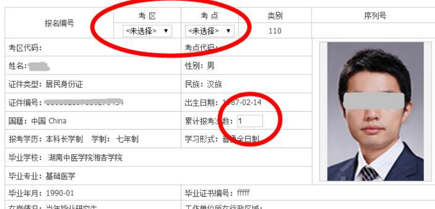
110 临床执业医师__(仅供测试) 考试报名暨授予医师资格申请表

最后需要用户再次检查本次报名信息并选择报考的考区和考点；同时，由于新的考试服务平台刚刚上线，需要往届考生补充填报累计报考次数一栏（首次报考考生可不予填写，默认次数为1）。完成后点击提交按钮即可结束报名，跳转回考试报名模块，选择打印申请表或其他操作。